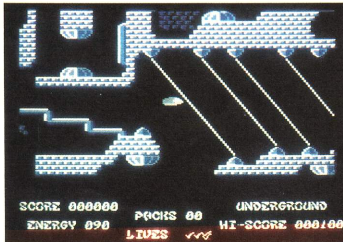
[2] Fest installierte Energiekanonen behindern Ihren Weg und entziehen der Bergungssonde Energie

er, und die Wissenschaftler begannen, eine bemannte High-Tech-Sonde zu entwickeln. Jetzt hat die vereinigte Atomföderation nach mehreren gescheiterten Missionen Sie ausgewählt, um die letzten Müllfässer zu bergen. Helfen Sie weiter und laden Sie das Spiel mit LOAD "UNDERGROUND", 8 dann Start mit Run. Nach einer kurzen Wartezeit im Titeldbild, lassen sich im High-Score die Ergebnisse Ihrer Vorgänger betrachten. Mit einem Druck auf den Feuerknopf (Port 1 oder Port 2) beginnt Ihr Auftrag. Um sich nicht selbst zu verseuchen, steuern Sie ein Roboterfahrzeug durch das kontaminierte Labyrinth; natürlich eine hochentwickelte Konstruktion mit besonderen Schutzschilden. Und da sich tief im Inneren der Erde keine Tankstelle befindet, wird die dafür benötigte Energie dem gerade aufgesammelten Behälter entzogen. Sie sollten also die Anzeige Ihres Energievorrats links unten am Bildschirm im Auge behalten.